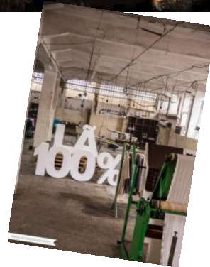
Covilhã – Cidade construída em Lã "Se os filhos de Adão pecaram, Os da Covilhã sempre cardaram". Adágio popular, séc. XVIII.