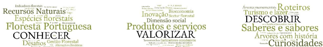
Figura 3. Nuvens de palavras dos temas e palavras-chave ( tags ) dos artigos nos Menus Conhecer, Valorizar e Descobrir.

O menu Descobrir agrega roteiros, sugestões para escapadinhas em família, curiosidades, árvores com história, saberes e sabores que lhe permitem vivências inspiracionais nas nossas áreas florestais.