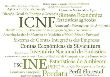
Figura 4. Exemplos de fontes usadas nos artigos do Menu Valorizar.